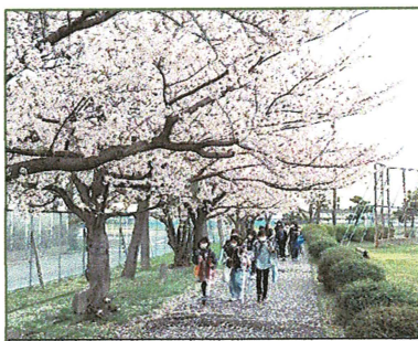
桜の咲く下を歩いて登校

新しく立仏小学校にお越しになられた8名の先生方の着任式の後、始業式が行われ6年生の決意表明や、校長先生のお話をお聞きました。