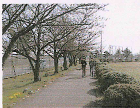
春空の下を元気に登校!!

新しく立仏小学校にお越しになられた9名の先生方の着任式の後、始業式が行われ6年生代表児童の「6年生になって頑張りたいこと」の発表や、校長先生のお話をお聞きました。