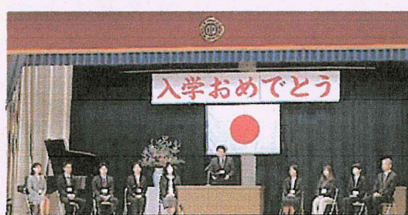
着任された先生方